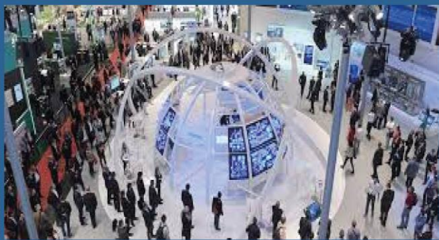
УЧАСТЬ У ВИСТАВКОВИХ ЗАХОДАХ 2022

Українські дипломати домовилися з виставковими операторами про можливість участі українських експортерів у 33 виставках по всьому світу на безоплатній основі або з суттєвою знижкою.