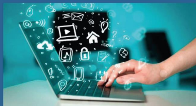
ПЛАТФОРМА ДЛЯ РОЗШИРЕННЯ БІЗНЕС-МОЖЛИВОСТЕЙ

Дізнатися більше та долучитися можна за посиланням .